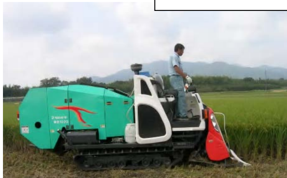
細断・攪拌機能が付加されたコンバイン型専用収穫機（細断型）