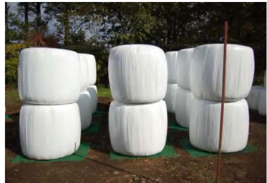
二段積みの広々配置 (鳥獣害対策)