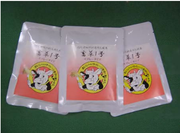
稲発酵粗飼料専用乳酸菌で 良質サイレージ調製