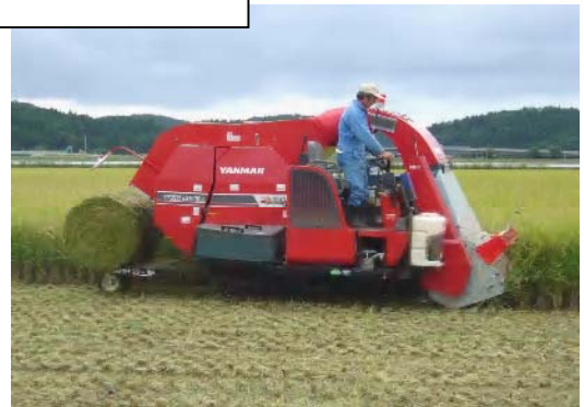
フレール型専用収穫機のロールキャリアを用いた刈り取り同時運搬作業