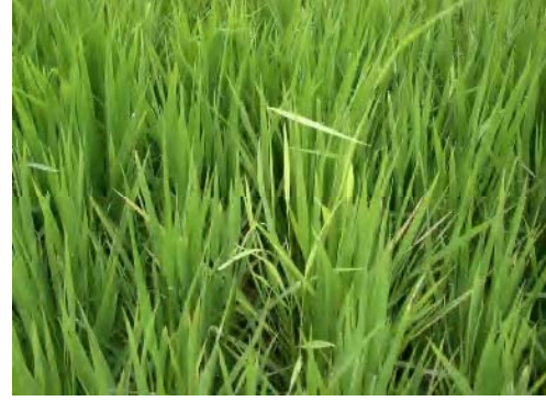
④ばか苗病（イネは黄化徒長して枯死）熊本県阿蘇市