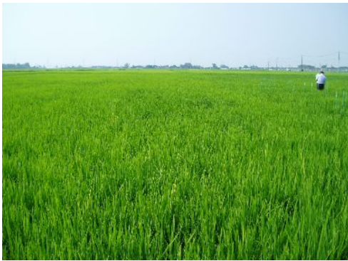
出穂期を迎えたWCS用イネ