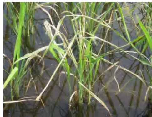
⑥コブノメイガ（止葉等の上位葉が食害を受けると減収）熊本県合志市