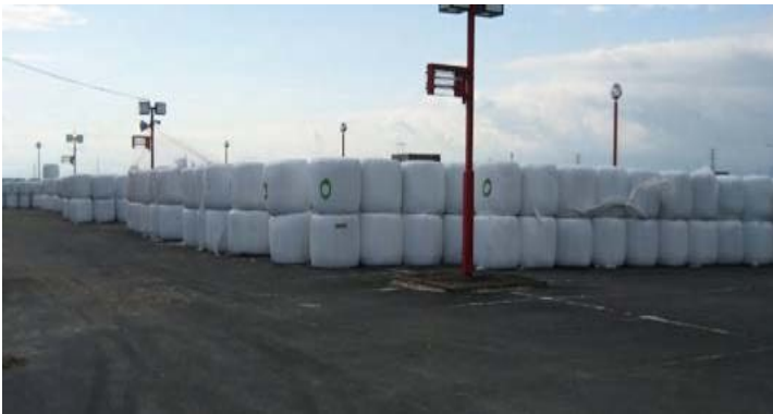
ストックヤードでの一時保管状況