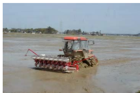
大区画ほ場での点播直播の播種作業