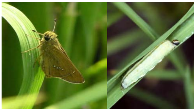
⑦イネツトムシ（イチモンジセセリ，幼虫は葉を綴って中に潜み，夜間に葉を食害する）