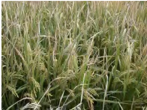
⑤白葉枯病（葉先や葉縁から病斑が拡大、激しいと全葉枯死）熊本県合志市