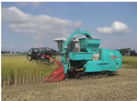
リールアタッチを装着した汎用型飼料収穫機