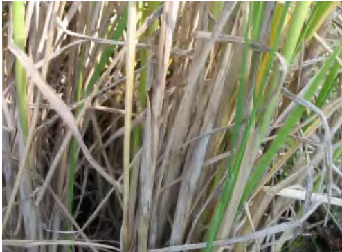
③紋枯病（初期病斑は水際の葉鞘に発生し、上位へ進展）熊本県合志市