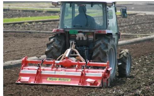
水田に水を張る前の耕起作業