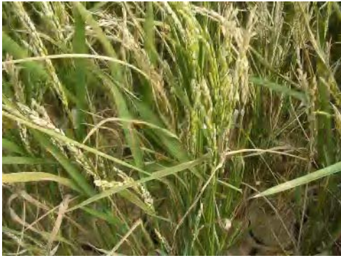
①いもち病（葉や穂が枯死し、減収や稔実不良）熊本県湯前町