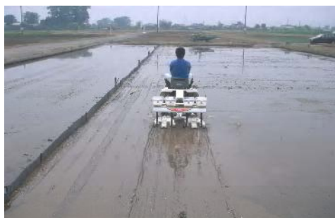
小区画ほ場での点播直播の播種作業