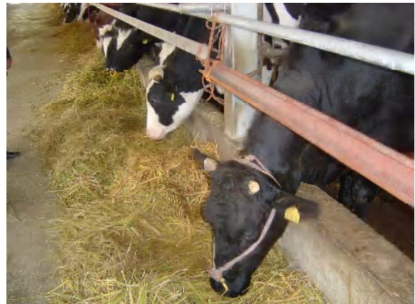
良質サイレージをたべる牛