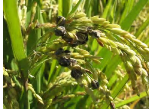
②稲こうじ病（もみだけに発生し、不稔や稔実不良に）熊本県阿蘇市