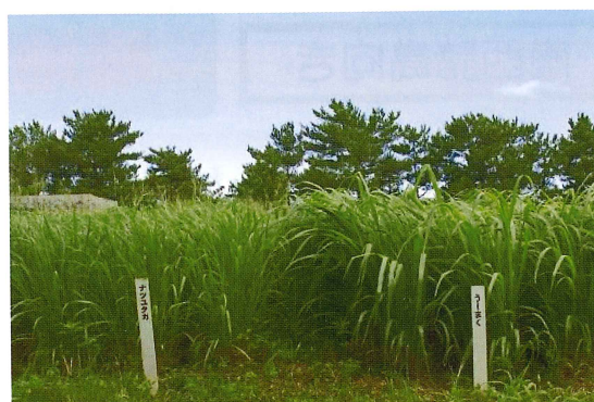
極多収品種「うーまく」(右)と多収品種「ナツユタカ」(左)