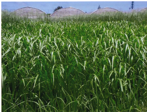
パイカジ草地（沖縄県宮古島）