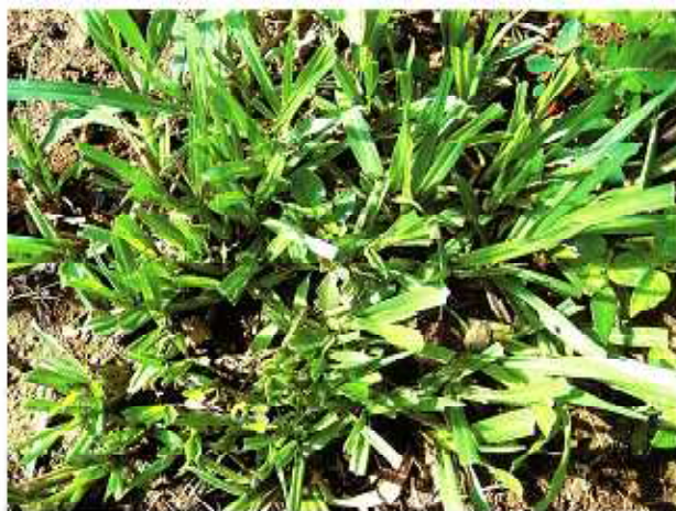
「ナンオウ」の採食状況