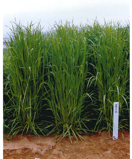
はたあおばの草姿