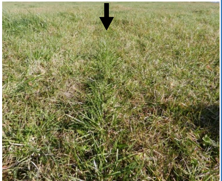
ペレニアルライグラス追播跡(矢印) 10月の道東地域(足寄)。