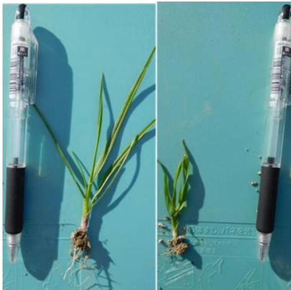
播種後約1か月のペレニアルライグラス(左)とチモシー(右)