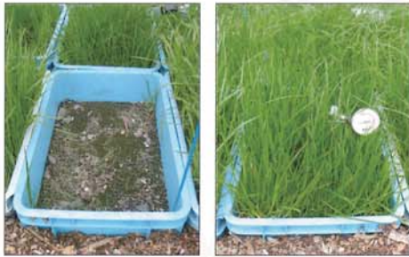
パーフェスト 東北1号 フェストロリウム