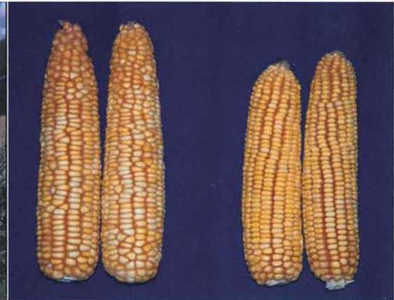
「ゆめそだち」雌穂(左) 右は中生品種の平均的雌穂