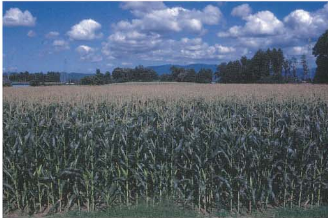
「ゆめそだち」の栽培全景