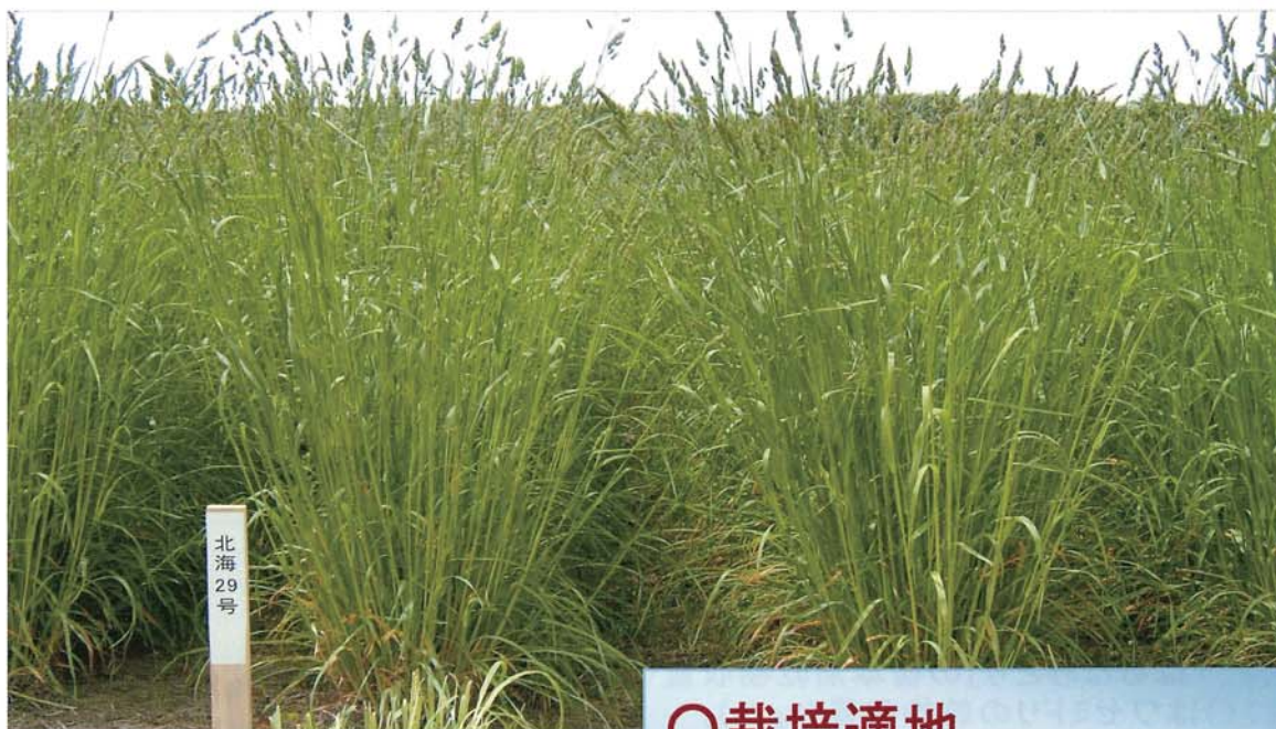
出穂期の「はるねみどり」