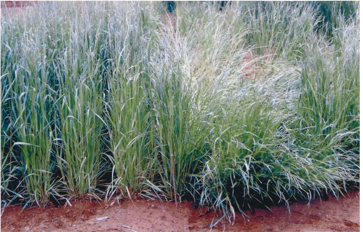
はたあおばとワセアオバの倒伏状況(H13年4月24日)