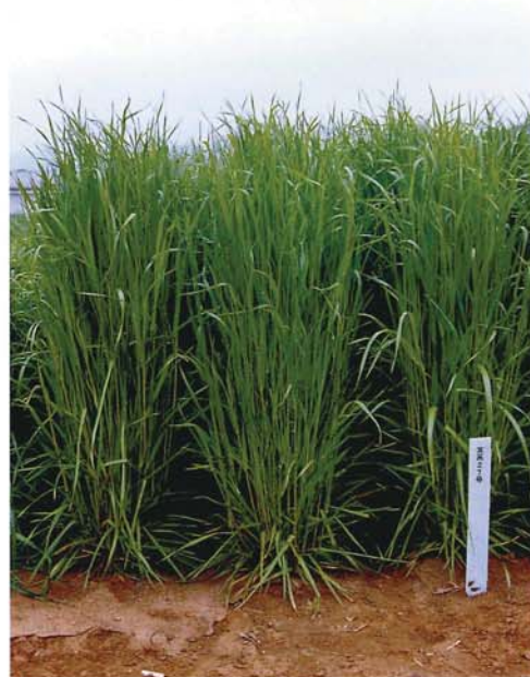
はたあおばの草姿