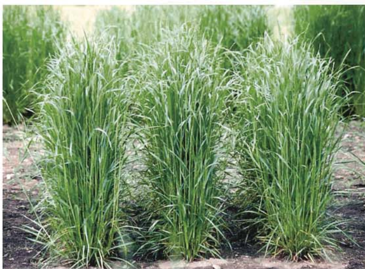
写真2 ニオウダチの刈取適期(出穂期)の草姿

農協・酪農協または(一社)日本草地畜産種子協会へお願いします。特性や栽培・利用方法に関するお問い合わせは、育成元である下記の畜産草地研究所へお願いします。