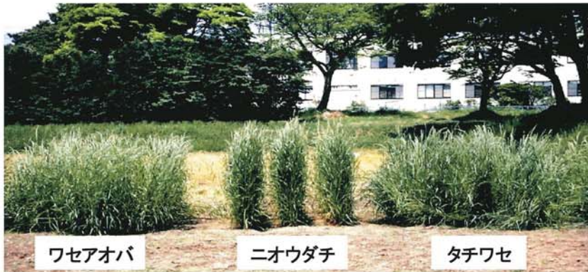
写真1 出穂期における倒伏状況